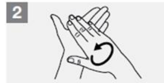
2 Nuddið höndum saman, lófa við lófa