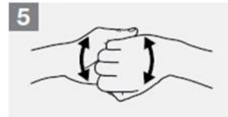
5 Nuddið fingur ofan í lófa gagnstæðrar handar