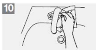
10 Skrúfið fyrir vatnið með þurrkenni