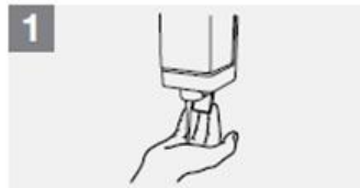
1 Fáíð ykkur sápu