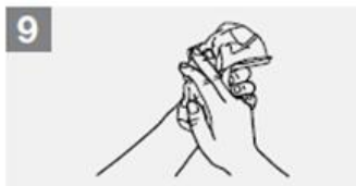
9 Þerrið hendur með pappírþurrku