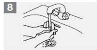
8 Skolið hendur með volgu vatni