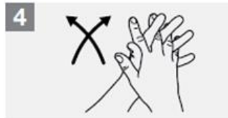
4 Nuddið á milli og í kringum fingur