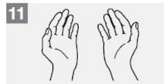
11 Nú eru hendur þínar öruggar

Heildartími handþvottar með vatni og sápu: 40-60 sekúndur