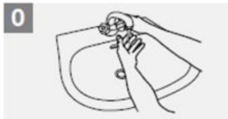
0 Bleytið hendur með vatni