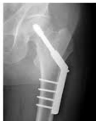
Plata og skrúfur